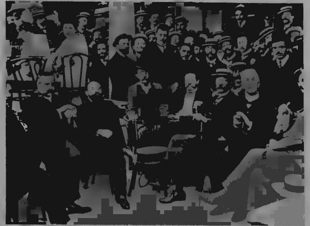
Giornalisti e medici a San Pellegrino il 25 giugno, sotto i portici presso la fonte.