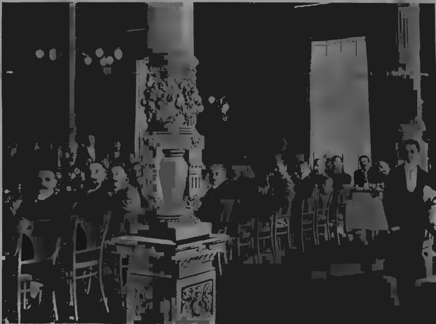
I medici riuniti a banchetto nel salone del Grand Hôtel di S. Pellegrino il 25 giugno.